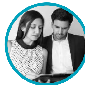
Directores y Gerentes Funcionales