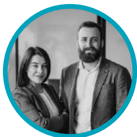
Gerentes de Riesgos y Cumplimiento