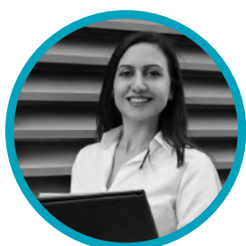
Responsables de SIG