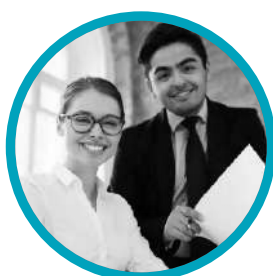
Audidores y Consultores ISO