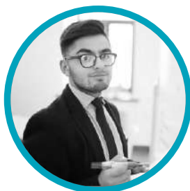
Oficiales de Cumplimiento